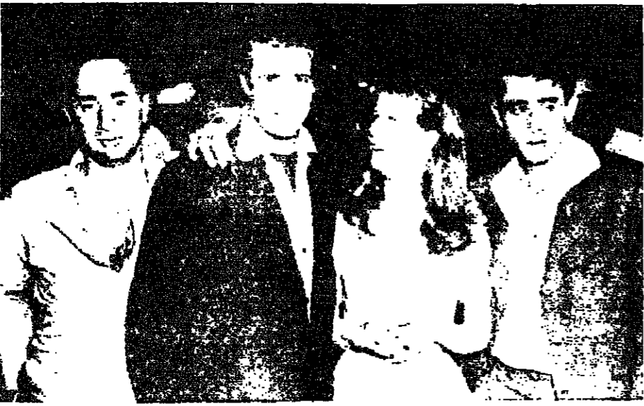
براندو، بيرون، كازان، خلال تصوير «جولي تيريس» و«جيمس لين»

حدث فيه جريمة قتل. واستطاع فيه كونرت، البقاء على قيد الحياة فوق إشلاء الآخرين. والديكور كله عبارة عن المكان الذي يستحضر فيه كونرت، هؤلاء الناس - أو بالأحرى هذه الذنوب - أمام الجمهور. وبمناه في المصمم ميليترز، وفي الوقت نفسه يسجل في دفتر الملاحظات كل خاطرة له عن الديكور والملاحظات التي يبني إبداعها للمصمم وظهور في أثناء العمل والمناسبات كثير من الاعتبارات الفنية والعملية التي واجهت تصميم الديكور. فكان هناك ميل دائم إلى إلغاء التفاصيل المادية. وأصبح كازان يعمل للاجتماع بـ ميلر - ومصمم الديكور ومساعد المخرج - روبرت وايتير - فراد يلخص أراءه التي سيدلي بها اليهم على الشكل الآتي: